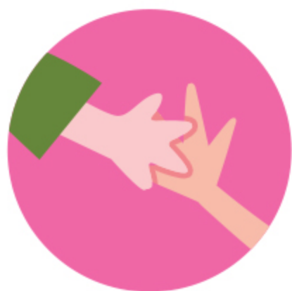
Aperto de Mãos