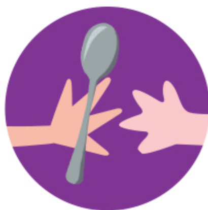
Tocar em objetos contaminados