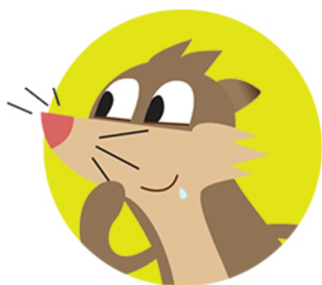
Gotinhas de Saliva